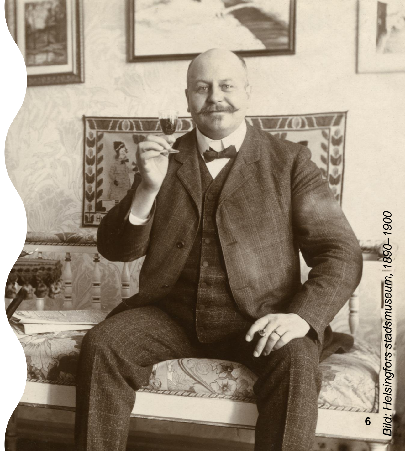
6 1890–1900

Kaupunginvaltuusto Stadsfullmäktige 1875–2025