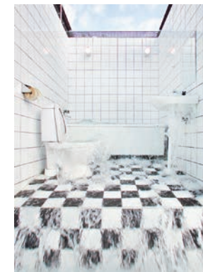
Badrummet , 2001 BO 0-1, Malmö Public Art Agency Sweden

Awakening II was compared to Marcel Duchamp's Fountain . I did not see the connection, but I was happy to see the work in an art-historical context instead of my own inner bubble.