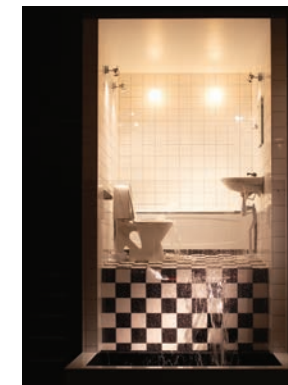
Awakening , 2014 Kulturhuset, Stockholm