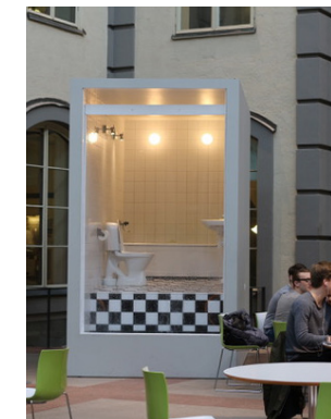
Awakening II , 2015 Stockholm School of Economics