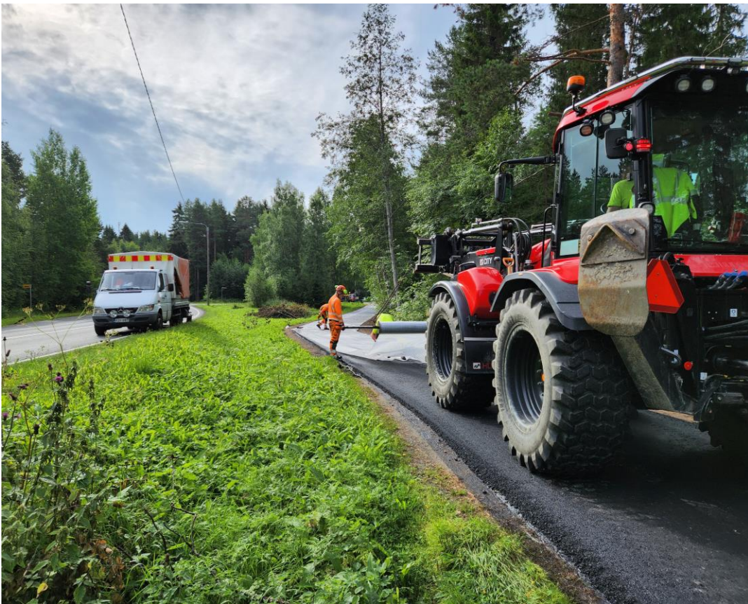
Päällystykseen yhteydessä lujiteverkon asennus Martinniementien jalankulun ja pyöräilyn väylälle, Oulu