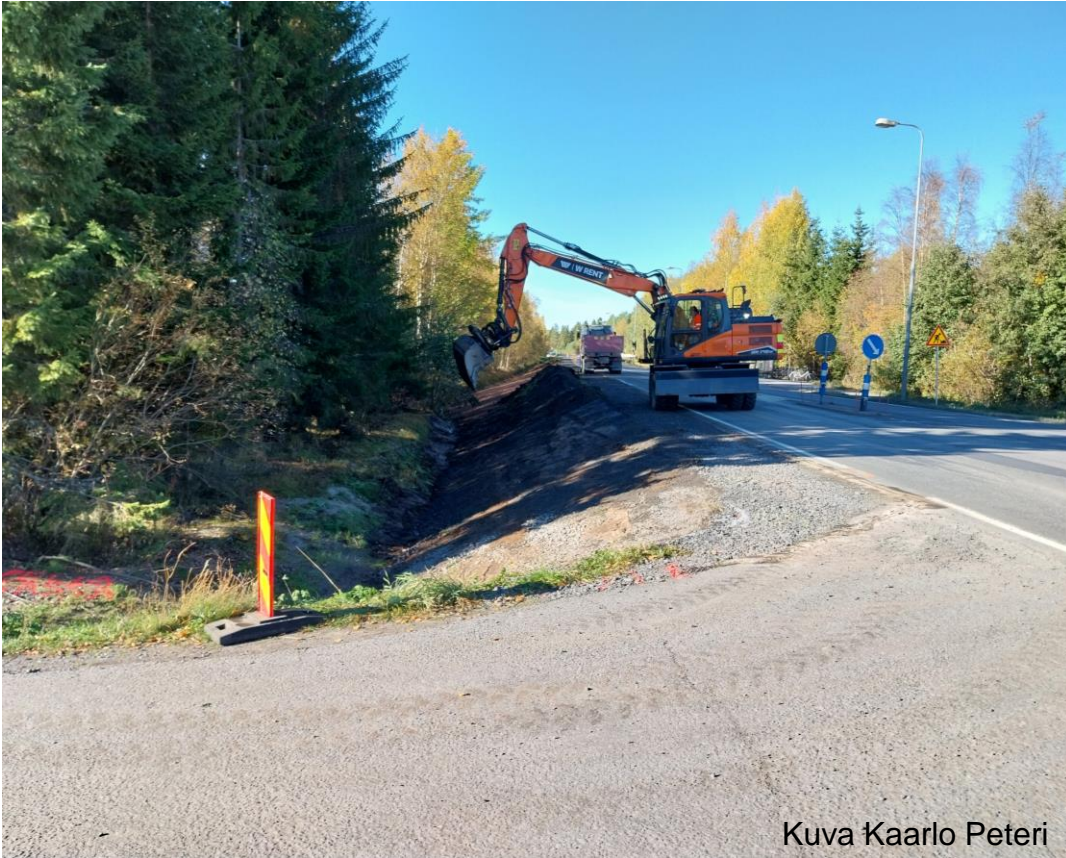
Kuva Kaarlo Peteri