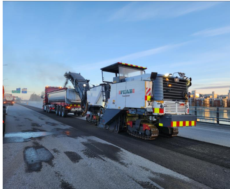
Vt 4 Oulujoen sillat