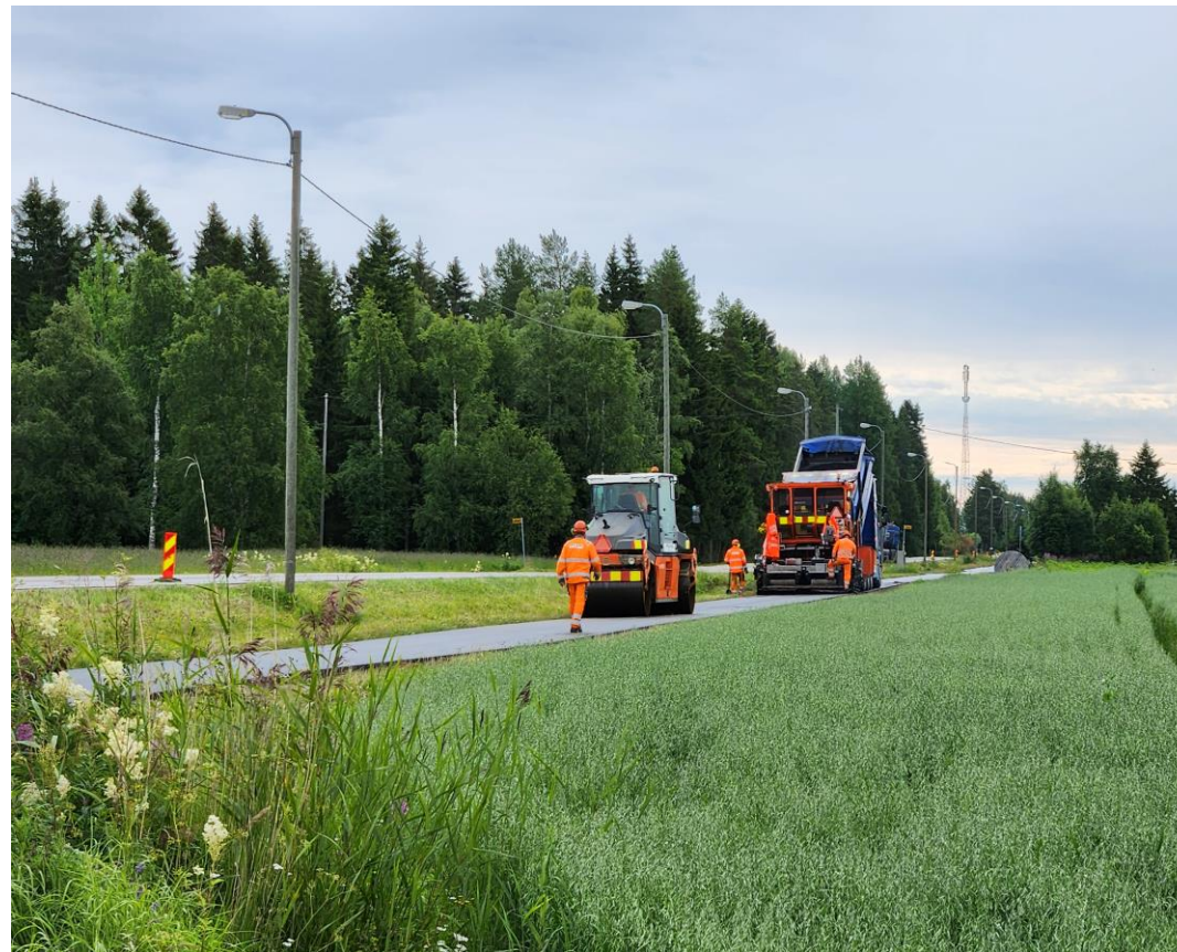
Ketolanperäntien jalankulun ja pyöräilyn väylän päällystystä, Kempele