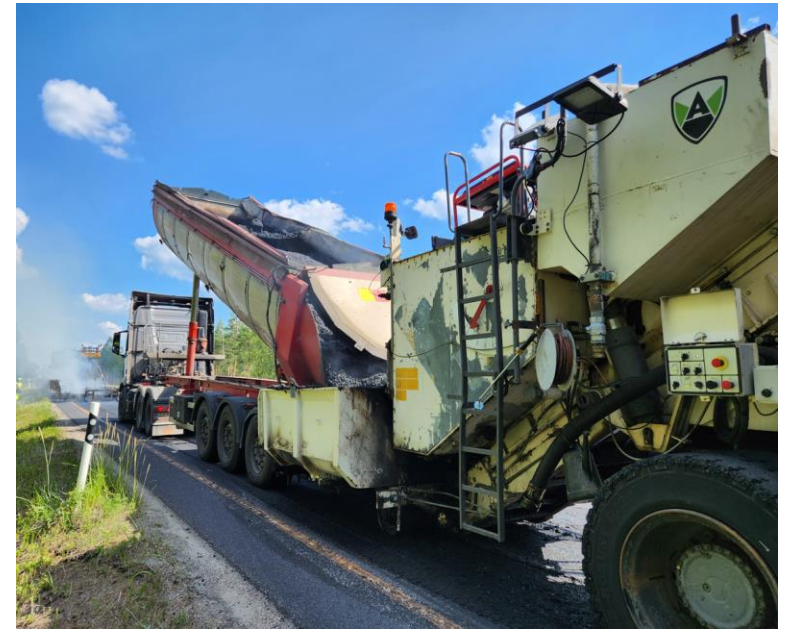
Vt 8 Siikajoki