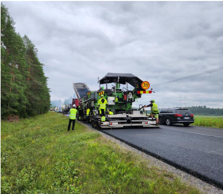
Vt 22 Muhos