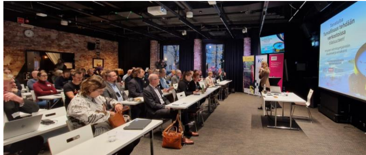
Kuva: Turvallisuus tehdään verkoissa -tilaisuus 26.11.2024 keräsi 80 osallistujaa hotelli Puijonsarven tiloihin Kuopioon.

Hiilineutraalipohjoissavo.fi/tapahtumakalenteri