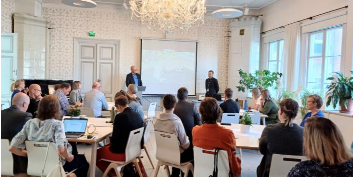
Kuva: Pohjois-Savon ilmastomuutokseen sopeutumissuunnitelman valmistelu käynnistyy teematyöpajoilla.

Aloituspajaa seuraa neljän työpajan sarja, joiden lisätiedot ja ilmoittautumislomakkeet löytyvät täältä (hiilineutraalipohjoissavo.fi) . Kaikki työpajat järjestetään Teams-yhteyksin. Työpajoissa esitellään pohjoissavolaisten lasten ja nuorten kanssa tehtyjä tulevaisuuskuvia Pohjois-Savosta vuonna 2050. Ammennamme tätä näkymää, kun suunnittelemme maakunnan sopeutumistyötä. Sopeutumissuunnitelman laadintaa koordinoi Pohjois-Savon ELY-keskuksen Hiilineutraali Pohjois-Savo - vastuullisesti ja vaikuttavasti (HIPOVA) -hanke.