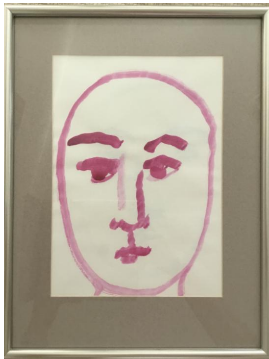
esimerkit siskoni tauluista