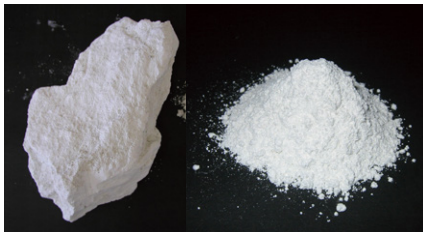
Ultra-Fitting Fine Powder

SENSAI-laboratorion huolella valitsema, luonnosta johdettu puuteriraaka-aine hankitaan Japanin vuoristosta. Japanilaiset artesaanit jalostavat puuteriraaka-aineesta hienostunutta puuterea ammattitaidolla valvotuissa olosuhteissa. Kyseessä oleva puuteriraaka-aine on alusta lähtien ollut olennainen osa TOTAL FINISH -meikkipuuteria sen korkean laadun ansiosta.