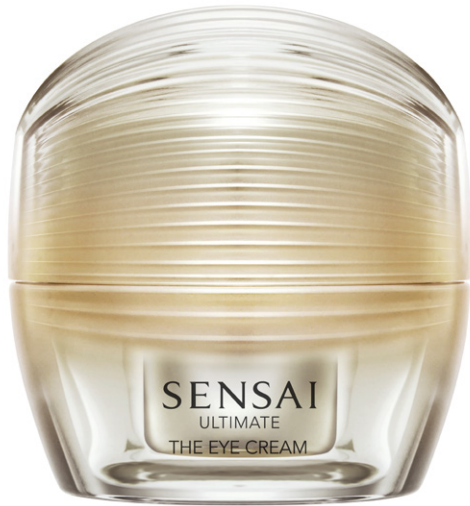
SENSAI ULTIMATE THE EYE CREAM 15mL

Ylellisen täyteläinen silmänympärysvoinde sulautuu iholle loisteliaasti, ja hemmottelee silmänympärysaluetta hellävaraisesti ravitsevien öljyjen runsaudella. Hellävaraisesti hierottuna voide kietoo ihon miellyttävän tunteen ja jättää silmänympärysalueen elvytetyksi ja pehmeän näköiseksi. Uusimman tieteellisen tutkimuksen inspiroima koostumus sisältää Koishimaru Silk Infinite ja Sakura Eternal Complex -yhdisteitä, jotka ovat tunnusomaisia ULTIMATE-tuotelinjalle. Kyseiset yhdisteet ovat avaintekijöitä ihon näkyvien ikääntymisen merkkien ehkäisemisessä ja edistävät ihon luonnollista uusiutumisprosessia. Kohotettu katse hehkuu uudessa valossa eläväisenä.